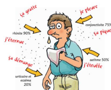
Figure 2 : Extrait exposition ambroisie