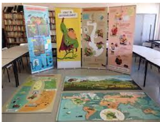
Figure 4 : Exposition Captain Allergo