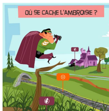
Figure 5 : Exemple de visuel du kit Captain Allergo

N'hésitez pas à revenir vers nous pour toute question sur ces outils et pour emprunter gratuitement l'exposition et/ou le kit.